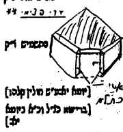
מנחה דרב קומץ רבה

ארעחא דנינה הוא דעבידא אביי רבא עברי כרבה דרב יוסף ורב אשי עביד כרב ושמואל לחומר (א) והילכתא "כרב ושמואל לחומר. איומרי לול ט פתח מן הבית לעלייה אמר רב הנצא יאם יש לו פתח אחד חייב במזוזה אחת. אמיש לו ב' פתחין חייב בשתי מזוזות. אמר רב פפא ישמע מינה מרוב הונא האי אינדרונא דאיית ליה ארבעה באבי חייב בארבע מזוזות. פשימא: לא צריכא אף על גב ד' דגיל בוד. אמר אמימר האי פיתוחא דאקניא חייב במזוזה אמר ליה רב אשי לאמימר הוא לית ל' ליה פצימין: אל' עדי פצימי רב. פפא איקלע לבי מר שמואל, חווא תרזא פיתוחא דלא היה ליה אלא פצימא ארס משמאל ועבידא ליה מזוזה, אל' כמאן כר' אמר דאמר ר' מלך משמאל מ' אמר: באי חייב דנינה ביתה: כיואך מן הימין, אחת אמר מן השמאל, או עניו אלא משמאל חל"ה יתחמא הלמדה אמר רב יוד' *כיואך מן הימין דבי עק איגיש כתיבה דמינא עק' *לרב שמואל בר אחא אמר כתיבה דרב פפא פשימה דריבא בר עולא אמר רבא יוסף היריע הכהן ארז אחד וקב חר בדלתו ויתן אותו אצל המזבח כמין בבוא איש בית ה' ונתנו שמה הכתנים שומרי הקף את כל הכסף המביא בית ה' *מא ר' ר' דנינה בית שאן ח' אלא פצימא ארס ר' מחיב במזוזה ורבכנס